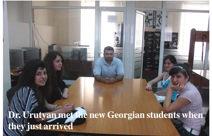
Dr. Urutyán met the new Georgian students when they just arrived

The entrance exams in May revealed the luckiest applicants to the ATC Summer Preparatory Course; thirty-seven are now attending the preparatory courses of Introduction to Agricultural Economics, Computer Applications, Business English, and Public Speaking.